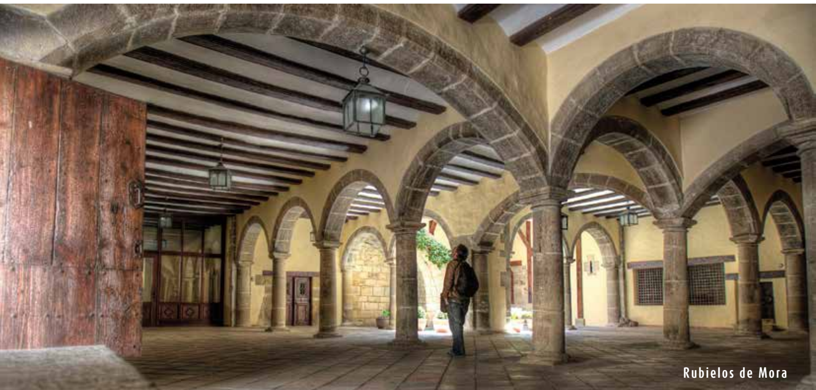
Rubielos de Mora